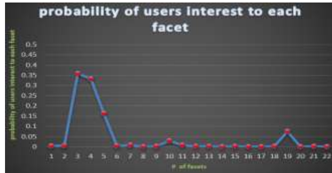
شکل ۲. احتمال علاقه کاربر به هر وجه