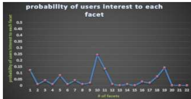
شکل ۳. احتمال علاقه کاربر به هر وجه

با توزیع وجه برای هر کاربر، تفاوت سلايق چندوجهی ( f_{dist} ) بين دو کاربر i و j می‌تواند بر اساس واگرایی جانسون - شانون ۱ بين دو توزیع وجه fd_i و fd_j اندازه‌گیری شود.