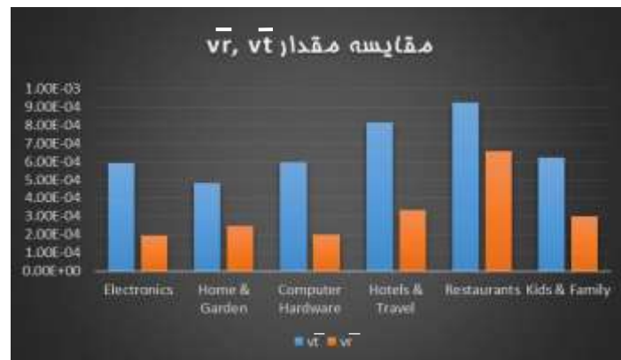
شکل ۵. مقایسه مقادیر \bar{v}_t و \bar{v}_r

همچنین می‌خواهیم بررسی کنیم که آیا توزیع شباهت چندوجهی هم متفاوت است یا