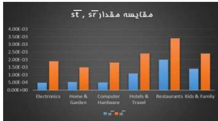
شکل ۴. مقایسه مقادیر \bar{s}_t و \bar{s}_r