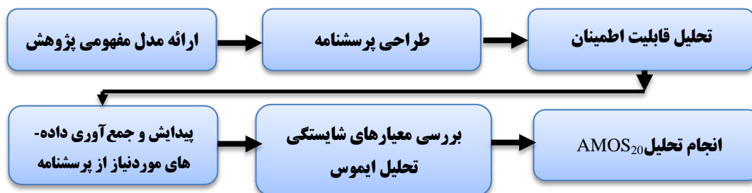
شکل ۲. ساختار و مراحل پژوهش

داده‌های این پژوهش با استفاده از نرم‌افزارهای اس.پی.اس.اس ۱ و اکسل ۲ در دو سطح توصیفی و استنباطی مورد تجزیه و تحلیل قرار گرفت. در سطح آمار توصیفی از جدول توزیع فراوانی، میانگین، انحراف معیار استفاده شد؛ اما در سطح آمار استنباطی از روش تحلیل عاملی تأییدی به منظور سنجش روایی سؤالات پرسش‌نامه و برای بررسی فرضیات تحقیق و طراحی مدل از روش مدل‌سازی معادلات ساختاری از نرم‌افزار ایموس استفاده شد. ساختار مراحل تحقیق به صورت خلاصه در شکل ۲ ارائه شده است.