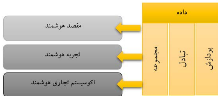
شکل ۱: اجزا و لایه‌های گردشگری هوشمند

گردشگری هوشمند را می‌توان به‌عنوان یک پیشروی منطقی از گردشگری الکترونیکی لحاظ کرد (بوهالیس، ۲۰۰۳). این خط سیر پیشرفت با بکارگیری گسترده از رسانه‌های اجتماعی ادامه‌دار شده است (سیگالا ۲ ، ۲۰۱۲) و به سمت وسوی شرایطی پیش می‌رود که به‌موجب آن گردشگری در تشخیص و انتقال اطلاعات گردشگران و مشتریان مربوطه بکار می‌رود (وانگ و زیانگ ۳ ، ۲۰۱۲). گردشگری هوشمند اساساً یک گام متمایز در تحول فناوری اطلاعات و ارتباطات ۴ در گردشگری است که به‌موجب آن ابعاد نظارتی و فیزیکی گردشگری وارد زمینه دیجیتال شده و سطح جدیدی از هوشمندی در سیستم‌های گردشگری به دست می‌آید (گرتزل، ۲۰۱۱). گردشگری هوشمند شامل اجزا و لایه‌های هوشمندی متعددی است که از طریق فناوری اطلاعات و ارتباطات حمایت می‌شوند (شکل ۱).