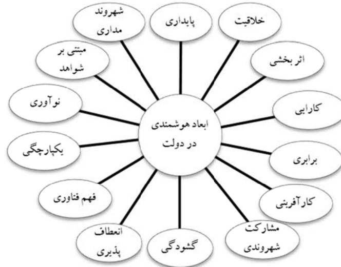
شکل ۱. ابعاد هوشمندی در دولت

اولین بار هوشینو و ژانگ ۱ (۲۰۰۷) و گاو و لو ۲ (۲۰۰۷) دولت هوشمند را مبتنی بر یکپارچگی داده‌ای در دولت الکترونیک مطرح کردند. گیفینگر و همکارانش ۳ (۲۰۰۷) نیز با بررسی شهر هوشمند از حاکمیت هوشمند به‌عنوان یکی از ۶ مؤلفه شهرهای مدرن نام می‌برند.