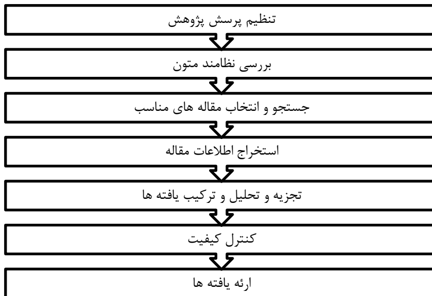
شکل ۱. مراحل هفت گانه روش فرا ترکیب

فرا ترکیب سندلوسکی و باروسو ۱ (۲۰۰۳) استفاده شده است که در شکل ۱ نشان داده شده است.